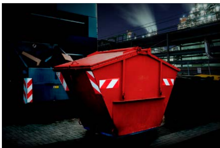
Avery Dennison Chevron White/Red wird zur Kennzeichnung von Container verwendet.

* Bitte beachten Sie, dass eine Ausnahmegenehmigung vorliegen muss, um fluoreszierende gelb-rote Warnstreifen und fluoreszierende Konturbänder auf Einsatzfahrzeugen anzubringen.