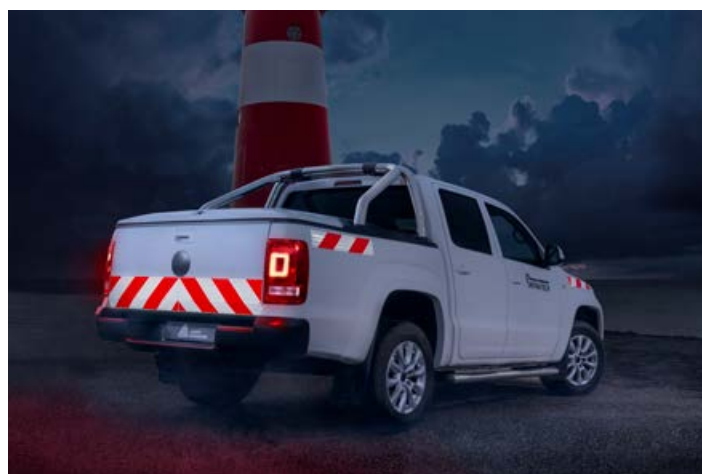
Avery Dennison Chevron White/Red zur Fahrzeugmarkierung nach DIN30710 und TPESC-B.